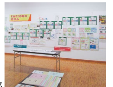
活動内容をパネル化して出展

SDGsをはじめ環境問題が重要視されている昨今、同社の取り組みを幅広く、身近に知っていただける機会として出展協力しました。