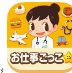
インタラクティブに社会の仕組みが学べます

伊藤ハムは2021年7月、(株)キッズスターが運営する子ども向け社会体験アプリ「ごっこランド」へ新パビリオン「あさごはんをつくろう!」を出店しました。これは幼児から小学校低学年のお子様を対象に、アプリのゲームの中でソーセージを焼いたり、ハムを盛りつけたりして朝ごはんをつくり、食育の観点から朝ごはんの大切さや食材をバランス良く食べる重要性を学ぶことができる体験コンテンツです。お子様やそのご家族の皆様が楽しみながら、実際の食生活へ活用されることを目指しています。