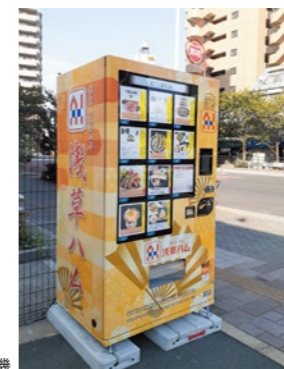
24時間気軽に購入できる冷凍自動販売機

浅草ハムでは2021年11月、東京都台東区の本社前に定番のソーセージや焼豚、こだわりのトリュフプロシュートなどを購入できる冷凍自動販売機を設置し、販売を開始しました。これはコロナ禍でも利用しやすいよう非対面で、24時間気軽に購入可能な直売所として設置したものです。商品をより身近に提供できる販売方法として自動販売機を設置することで、更なる地域密着と新たなお客様との接点拡大、および認知向上の場となることを目指します。